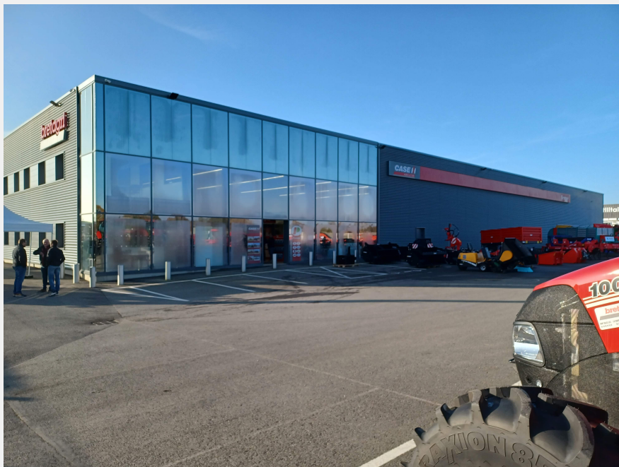
Bretagri deckt mit dem Stammhaus in Saint-Gilles und 2 weiteren Outlets in den Gemeinden Val d'Oust und Cossé-le-Vivien 3 Departements in Westfrankreich für die Marke Case IH ab.

Die Gruppe Emil Frey France - bislang mit 266 Standorten in Frankreich im Vertrieb von 29 Marken (Autos, Industriefahrzeugen, Motorrädern) und Ersatzteilen aktiv - investiert nun in den Agrarsektor. Sie hat am 1. Februar den Case IH-Vertriebspartner „bretagri“ übernommen, der 3 Departements im Westen Frankreichs (Ille-et-Vilaine, Mayenne und Morbihan) abdeckt.